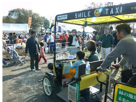
「日吉まつり」会場を走る自転車タクシー

なお、本事業では「かわさき市民公益活動助成金」を活用しているが、その中間報告に当たるアンケートを11月末に回答した。その内容は別紙の通り。さらに年度末には報告書を提出するため、年明けにはその書類作業に取りかかる。会計は遅くとも2月には仮締めするので、経費精算が残っている場合は来月までにご用意いただきたい。