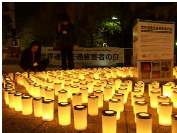
横浜マリントワー前でのキャンドルナイトの様子 (全国交通事故遺族の会主催)