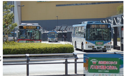
3月の写真「公共交通でエコライフ!バスをご利用ください。」

持続可能な地域交通に関するものや、川崎市内の風景で季節感のあるもの、徒歩・自転車・公共交通で快適に過ごせる場所などの写真またはイラスト (自作のものに限る) を、題や簡単な説明文を付けてご応募いただきたい。原則として横400px・縦480px以内で縦横比を変えずに縮小して掲載。