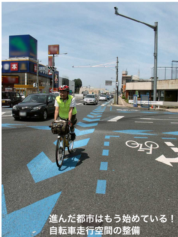
進んだ都市はもう始めている！ 自転車走行空間の整備

今、自転車活用政策が劇的に動き始めています。 自転車をスマートに使い、安全・快適で環境にやさしいまちにするために 欠かせない自転車活用政策とその最新事例を、専門家から学びます。