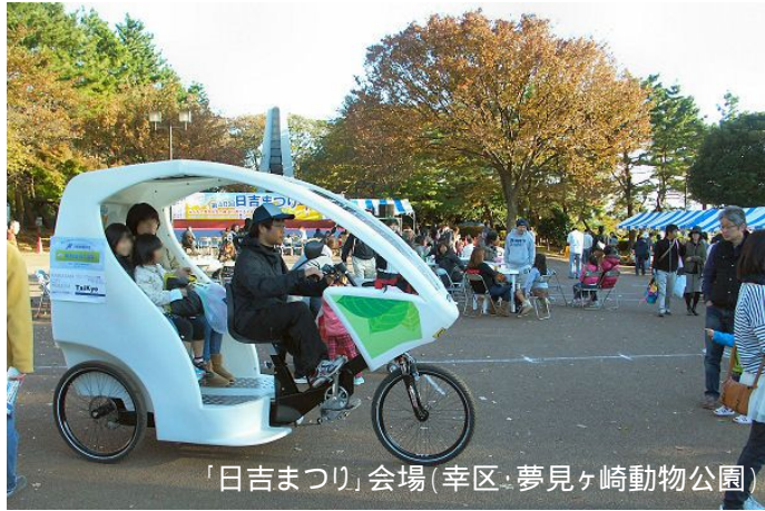
「日吉まつり」会場(幸区・夢見ヶ崎動物公園)

最新の自転車タクシー「シクロポリタン」が、市内3区(川崎、幸、中原)を走りました。