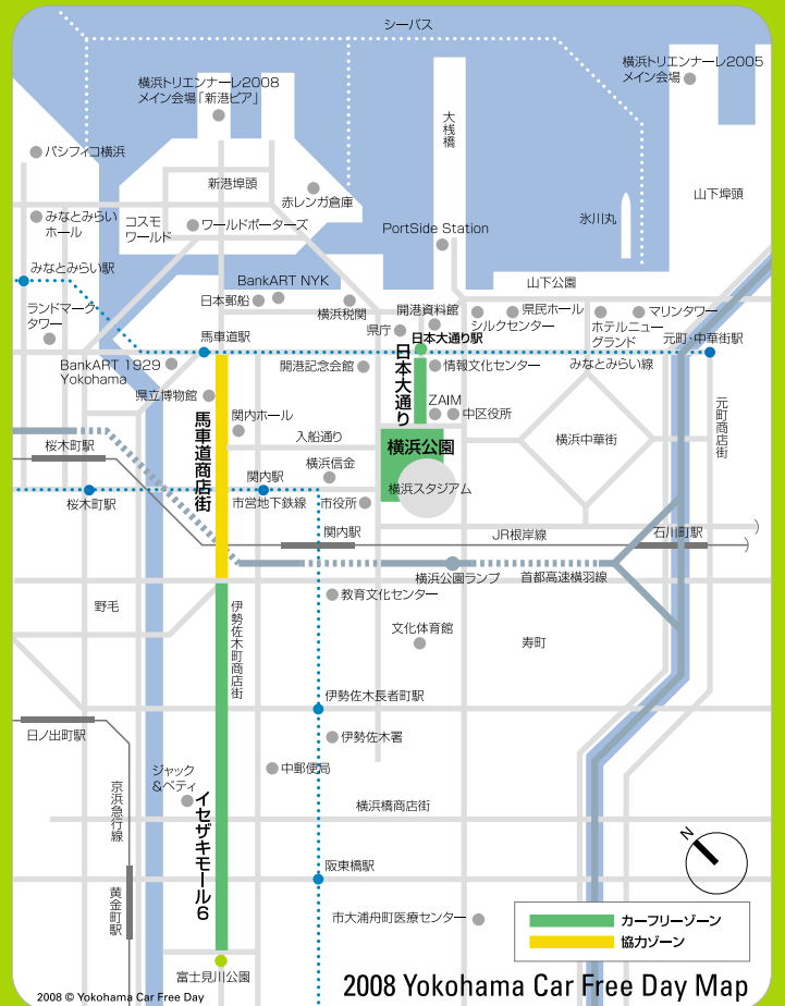
横浜カーフリーデー2008マップ